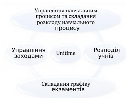
Рисунок 1.1 – Структура системи UniTime

UniTime підтримує складання розкладів курсів та іспитів, управління змінами в цих розкладах, спільне використання аудиторій з іншими заходами і розподіл студентів за окремими курсами (див. рис. 1.1).